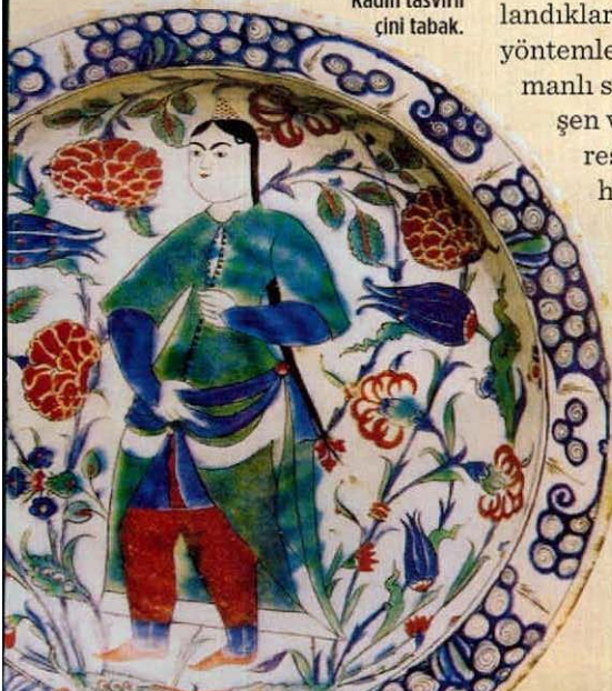
Kadın tasvirli çini tabak.

mekânlarında, eşyalarında oluşturduğu zengin tasvir dünyasına dikkat çekiyor.