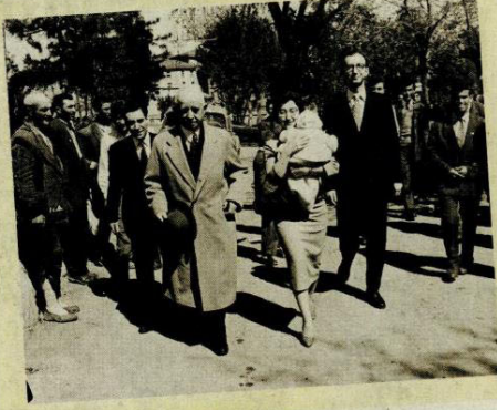
İsmet İnönü, kızı Özden ve oğlu Erdal ile, 1957.