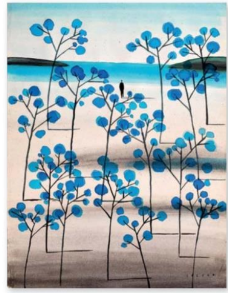
2019 tarihli "Bekleyiş", kâğıt üzerine sulu boya.