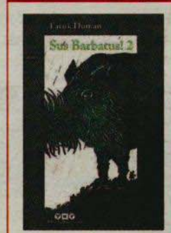
Sus Barbatus! 2 Faruk Duman Yapı Kredi Yayınları 592 sayfa

Edebiyat ve doğanın iç içe geçtiği eserlerin yazarı oldu Faruk Duman kalem yaşantısının başından beri. Doğa, romanlarının ve öykülerinin içinde kahramanlarının yanında bir başka kahraman olarak yer aldı hep. Dolayısıyla doğa, yazılanların ardına yerleşen bir fondan ya da dekordan ibaret değildi Duman için. Aksine; metne karakterini, ruhunu veren unsurların başını çekiyordu. Bu paralelde diyebiliriz ki Faruk Duman doğanın edebiyatından çok edebiyatın doğasını ortaya koydu kaleminden çıkanlarla ve bunun en önemli örneklerinden birini de 2 "Sus Barbatus!" ile verdi.