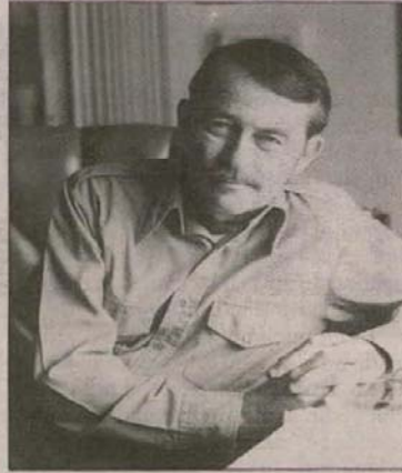
Western romanlarının ünlü yazarı olarak tanınıyor Glendon Swarthout.

Western kavramı, bu fikir temeli üzerine kuruludur. Aynı şekilde -en azından kâğıt üstünde- bugünün ABD'sinin siyasi temelleri de... Yani western sadece filmlerden bildiğimiz, at üstünde silahlı adamların koştuğu bir dünyadan ibaret değil. Çok daha fazlasını bünyesinde barındırıyor ve etkileri bugünlere kadar uzanıyor. Basitmiş gibi görünen bir western filmi başka gözle izlediğimizde dahi, önümüze farklı bir tablonun serileceğinden emin olabilirsiniz.