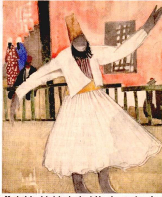
Mevlevi dervişlerini yakından takip eden sanatçı onların resimlerini de çizer.

ama kadınların da bulunduğu resimler çoğu. Camiler Gritchenko'nun en çok uğradığı yerlerden. Camilerin içine girip resimler yapıyor. Şehirdeki İngiliz zulmüne sıklıkla şahit olsa da ilginçtir askerler ressamın ilgi alanı dışında. Ama günlüklerinde İngiliz ve Fransızların yaptıklarını anlatıyor. O günlükleri Gritchenko 1930'da İstanbul'da İki Yıl adıyla yayımladı. Bu kitap da Yapı Kredi Yayınları tarafından ilk defa Türkçeye çevrildi. Ve o kitap işgal altındaki İstanbul'un nasıl bir ruh hali içinde olduğunu anlatıyor.