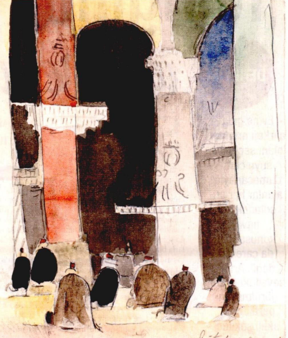
Ressam sık sık camileri ziyaret eder. En çok da Ayasofya'ya. Ve Ayasofya'nın içinden resimler çizer.