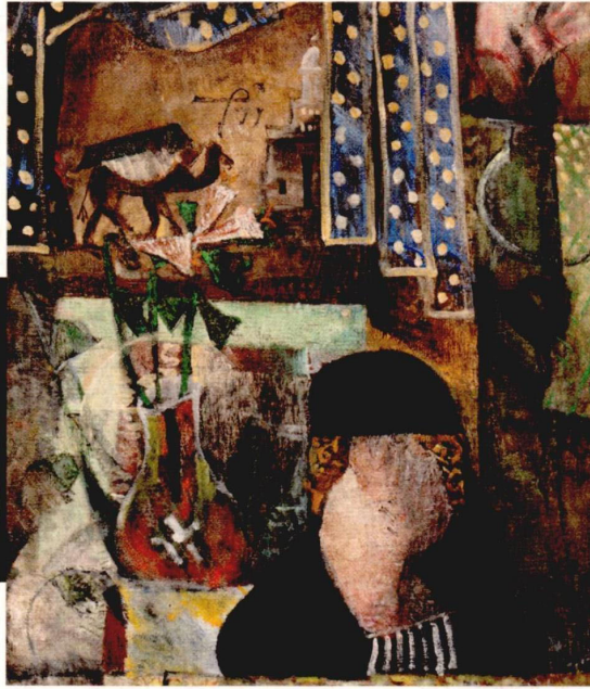
Sanatçı, eserlerinde sıklıkla erkekleri resmetse de zaman zaman kadınların da portresini yapmış.