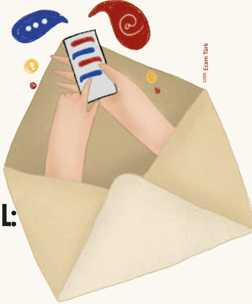
CİZER: Ecem Türk