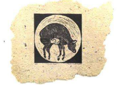
Nalan Yırtmaç, Kuzu Aşkı, 2019