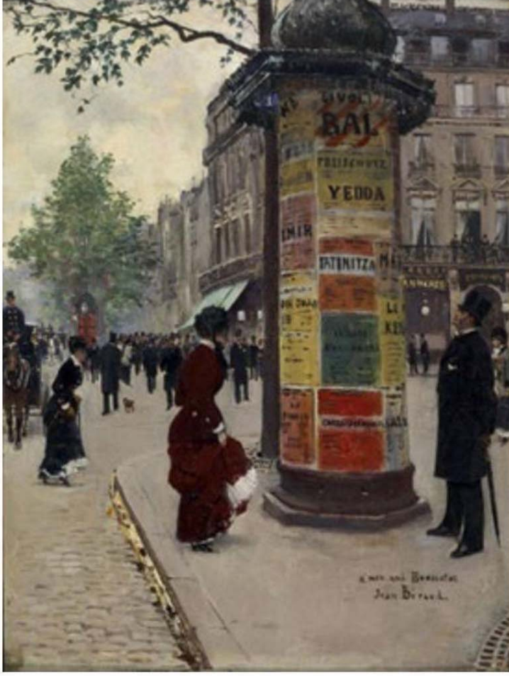
Jean Béraud'nun fırçasından Proust'un da çocukken gidip opera ve konser afişlerine baktığı Paris'in ikonik Morris ilan sütunu

bir torunun tonlamasında, hareketinde, onun hiç görmediği dedesini görür gibi olan aile ahbabının tebessümü yayıldı dudaklarına. Nasıl ki öyle bir durumda benzerliği kanıtlayabilecek fotoğraflara bakılırsa, ben de piyanoya, Vinteuil Sonatı'nın üzerine Tristan'ın notalarını yerleştirdim; tesadüf, tam da o gün, öğleden sonra, Lamoureux konserleri dizisinde bu eserin bazı parçaları çalmıyordu." İşte Proust'un evreni, gerçek dünyadan bulduğu o küçük fragmanları edebiyatına yerleştirerek böylesine küçük ipuçlarıyla bize göz kırpması, bizi düşündürmesi ve belki de onun izinde, Jean Béraud'nun insanın içine sıcaklık veren o rengârenk Belle Époque tablolarındaki Paris'te bir Lamoureux konserinde Tristan'dan pasajlar dinlerken "hayatta boşuna aradığımız o bireysellik izlenimini" daha iyi kavrayabilmemizi sağlayabilmesi; kurgusal bir romandan yola çıkıp gerçek hayata dair verilen bir mesaj niteliğinde kitabının sayfalarında dizili o kıymetli nasihatlerden sadece bir tanesi.