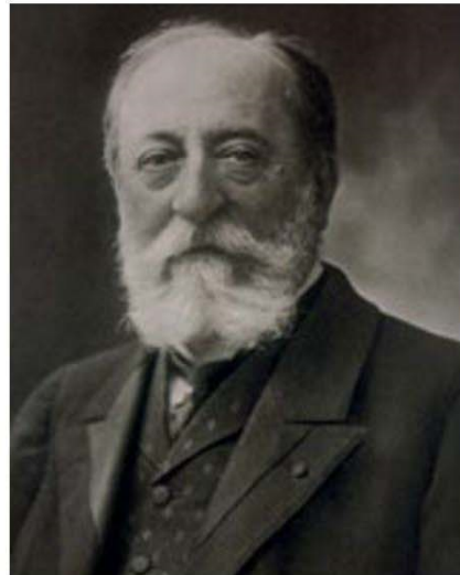
Vinteuil'in Sonata 'na ilham verdiği tahmin edilen Camille Saint-Saëns

Proust'un çalışma tekniğinde romanındaki kurgusal karakterlerin de gerçek hayattan modeller üzerinden yaratıldığı, bazen bir karakterde birden fazla kişiliğin üst üste getirilerek özgün bir kahramana dönüştürüldüğü çok iyi bilinmektedir.