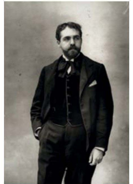
Proust'un yakın arkadaşı besteci Reynaldo Hahn

Romanın beşinci cildi olan Mahpus 'ta ise Proust, Wagner'e dört sayfa ayırmıştır: "Piyanonun başına oturup ortada duran Vinteuil Sonatı'nı rastgele açtım ve çalmaya koyuldum (...) Büyük sanatçıların her biri, gerçekten de diğerlerinden çok farklıydı ve her biri, günlük hayatta boşuna aradığımız o bireysellik izlenimini fazlasıyla uyandırıyor. Tam bunu düşündüğüm sırada, sonatın bir ölçüsü dikkatimi çekti; aslında gayet iyi bildiğim bir ölçüydü, ama bazen dikkatimiz çoktandır bildiğimiz bir şeyi farklı bir biçimde aydınlatır ve daha önce hiç görmediğimiz bir yanını fark etmemize yol açar. Bu ölçüyü çalarken, Vinteuil aslında o notalarla Wagner'in hiç aşına olmadığı bir hülyayı ifade ettiği hâlde 'Tristan!' diye mırıldanmaktan kendimi alamadım,