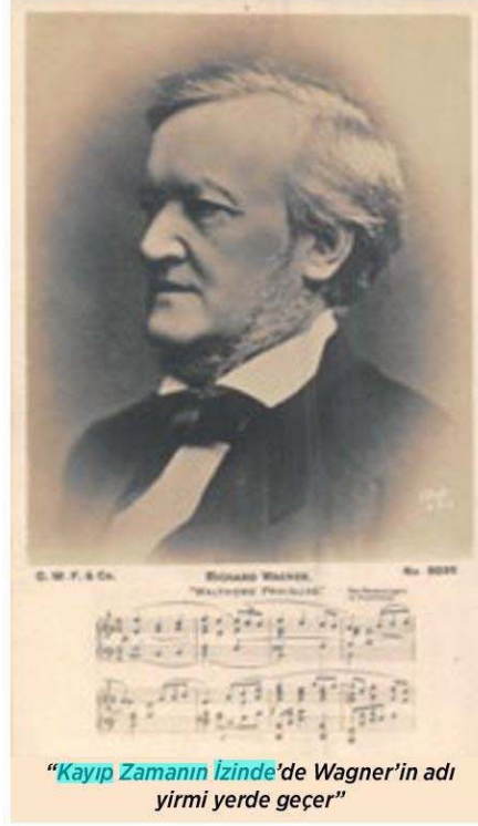
"Kayıp Zamanın İzinde'de Wagner'in adı yirmi yerde geçer"