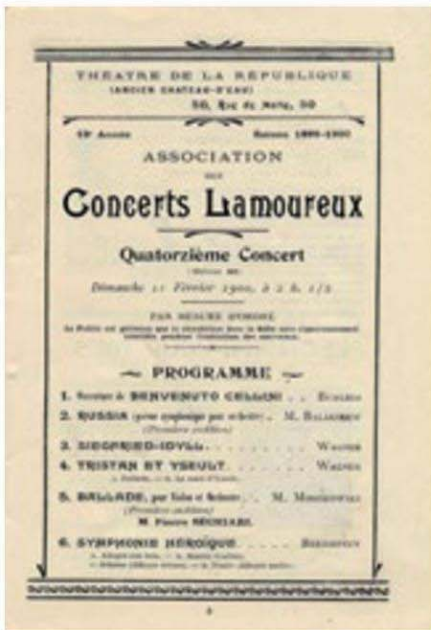
Lamoureux konserleri dizisinde Wagner'in Tristan ve Isolde prelüdü , 11 Şubat 1900