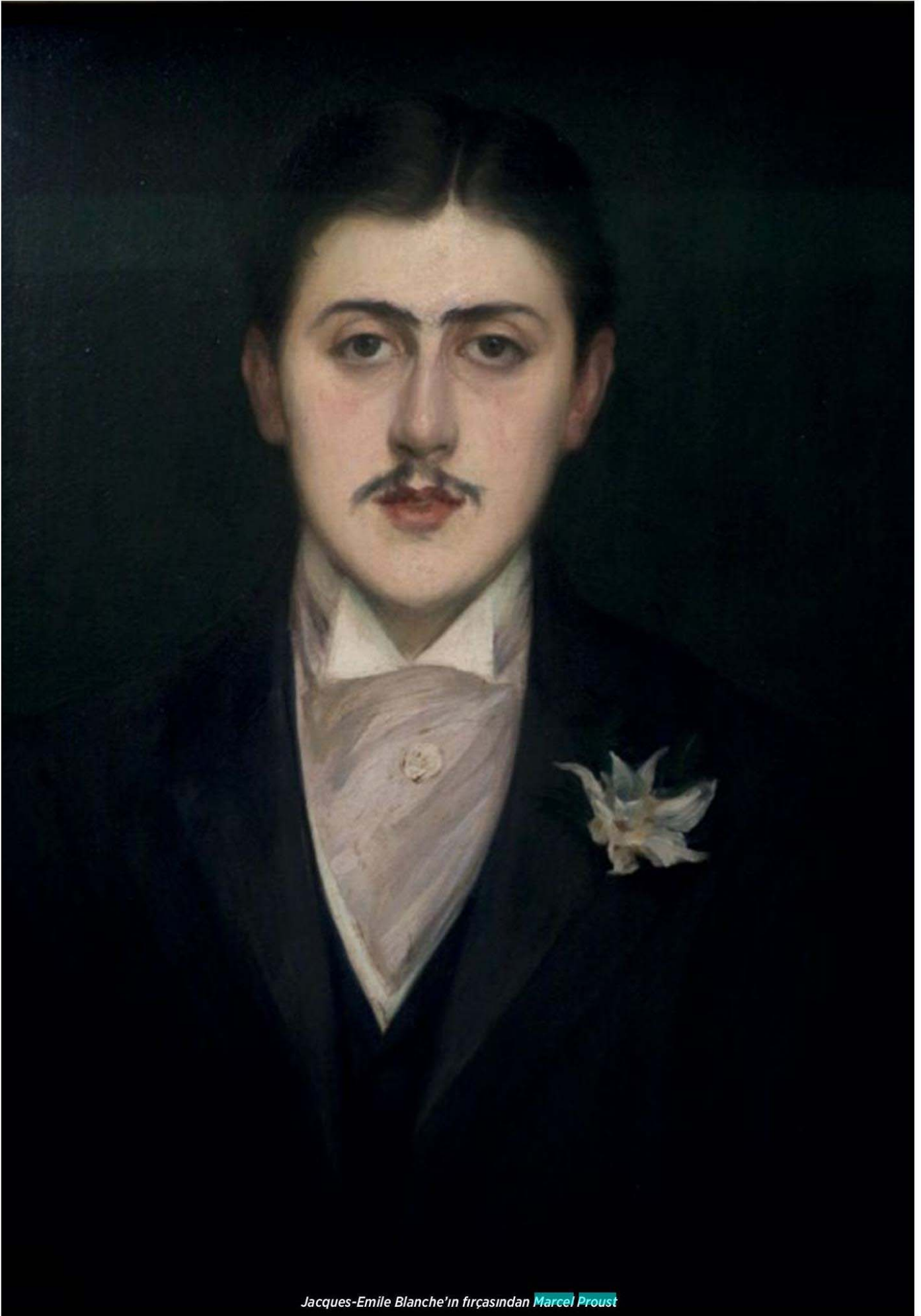
Jacques-Emile Blanche'in firçasından Marcel Proust