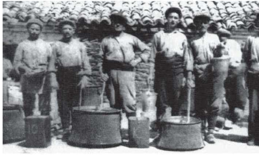
Shinudi köyünde 15 Ağustos'ta kutlanan Meryem Ana Yortusu'na atfen, Panayia Kilisesi'nin avlusunda