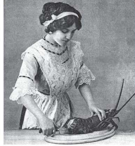
Haşlanmış ıstakozu dilimleyen kadın