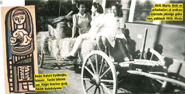
Bedri Rahmi Eyüboğlu, İsimli, Tarihi bilinmiyor, Kağıt üzerine guaj, OADA Koleksiyonu