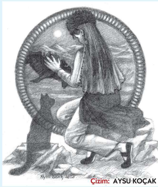
Cizim: AYSU KOÇAK