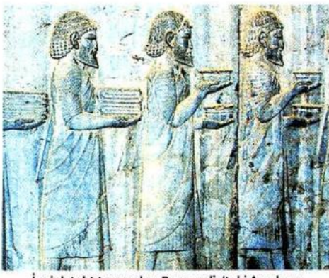
İonialı taht taşıyıcılar. Persepolis'teki Apadana merdiveninden bir kabartma.