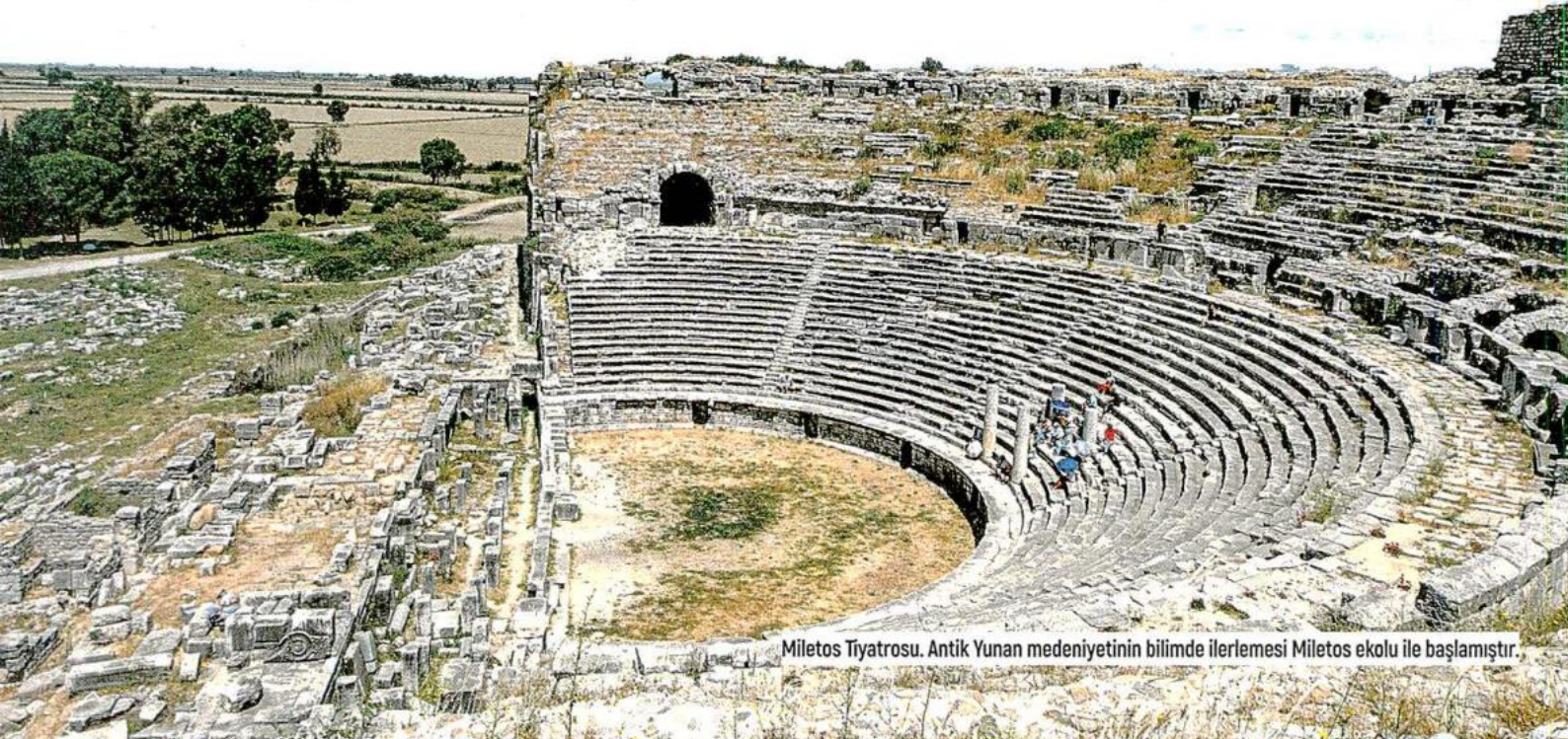
Miletos Tiyatrosu. Antik Yunan medeniyetinin bilimde ilerlemesi Miletos ekolu ile başlamıştır.

Arkeolojinin bir bilim olarak ortaya çıkışı