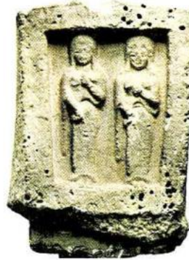
Miletos'tan örtülü iki kadının betimlediği stel. (Berlin Staatliche Museen)