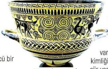
Khios'ta (Sakız Adası) bulunan, "chalice" adı verilen bir tür kadeh.

Kitap, belki de bu üç araştırmacının öncülüğünde başlayarak bugüne dek uzanan bütün sürecin bir dökümü. Zira "İonialılar", günümüzden yaklaşık 2600 yıl öncesine denk gelen İonia Bölgesi'nin tarih öncesi çağlarını da kapsayan "derin" tarihe ışık tutuyor. Arkaik Dönem'de İonia Paleocoğrafyası, kent devletleri, deniz aşırı bölgelerdeki, Karadeniz'deki, Pers egemenliği altındaki İonialılar ve Geç Klasik Dönem'de İonia gibi konuları, bilimsel araştırmalar ve disiplinlerarası referanslarla inceliyor.