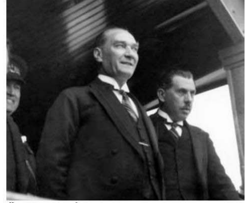
Özel treniyle İstanbul'a gelirken

atan İpek Çalışlar, Mustafa Kemal Atatürk Mücadelesi ve Özel Hayatı kitabıyla, ölümünün 80. yılında bizi bambaşka bir liderle tanıştıyor.