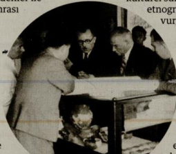
Atatürk 1937 yılında düzenlenen II. Türk Tarih Kongresi'nde Hasan Rıza Soyak, Sükrü Saracoğlu ve beraberindekileri Alaca Höyük kazılarında çıkarılan tarihi eserleri inceliyor

Cumhuriyet'in 100. yılına özel olarak hazırlanan Bir İdealin Peşinde: Atatürk ve Alaca Höyük Sergisi , 10 Mart 2024'e kadar Yapı Kredi Müzesi'nde izleyicilerini bekliyor.