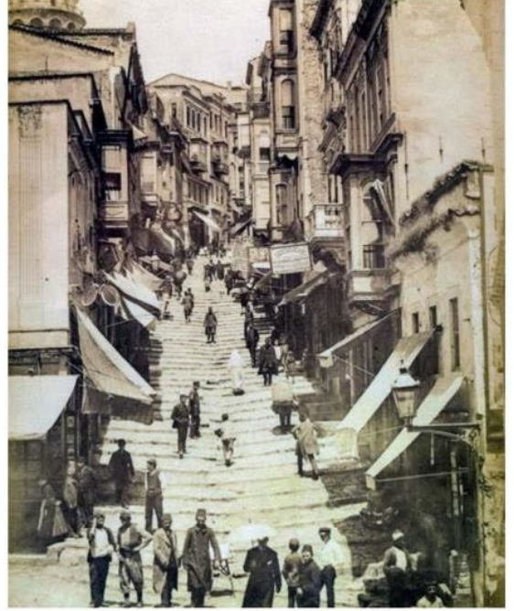
Her tarafından gramofon, Rumca şarkı, balalayka ve saz sesleri gelen İstanbul sokakları.