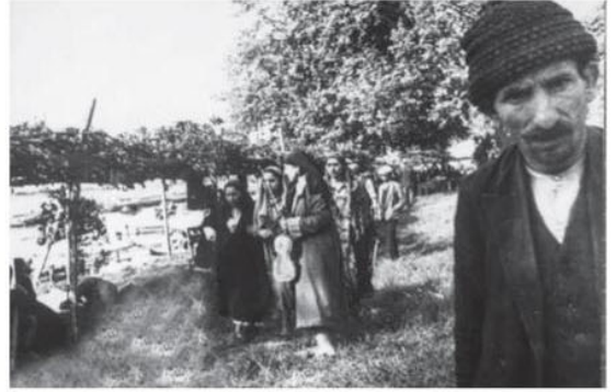
Kağıthane'deki mesire yerinde çalgıcılar.