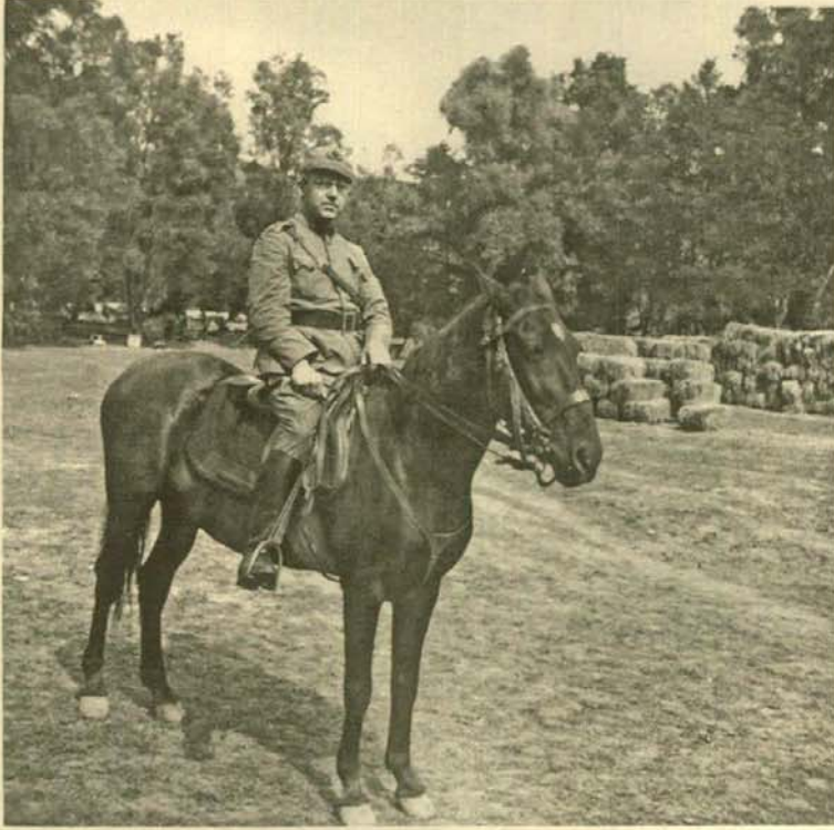
Eylül 1940, Büyükdere.

A 'dan Z'ye başlığı altında daha önce Nâzım Hikmet, Abidin Dino ve Sait Faik gibi ustaların yaşamlarını kitaplaştıran Yapı Kredi Yayınları, Sabahattin Ali hakkında yapılan çalışmalarda kaynak olarak yararlanılan "A'dan Z'ye Sabahattin Ali" kitabının genişletilmiş yeni baskısını okurla yeniden buluşturdu.