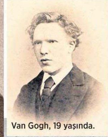
Van Gogh, 19 yaşında.

Kitapta , ressamın daha çok kardeşi Theo için kaleme aldığı mektuplar bulunuyor.