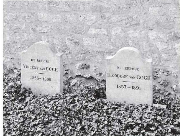
Ressamın ve kardeşinin mezarları da kitapta yer alıyor.

Kitapta , ressamın daha çok kardeşi Theo için kaleme aldığı mektuplar bulunuyor.