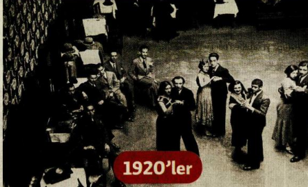
1925'te önce İzmir'de ardından Ankara'da ilk balolar düzenlendi.

Otomotiv devi Ford, 1929 yılında İstanbul'da, Tophane nhtımında bir montaj tesisi kurarak üretime geçti. Nusretiye Camii'yle nhtım arasındaki antrepo binalarından altısı Ford Motor Şirketi'nin fabrikalarından birine dönüştürüldü. Geceli gündüzlü çift vardığı çalışarak günde 150 motorlu taşıt üretime umuduyla işe başlayan fabrikanın bir ölü yatırın olduğu kısa sürede anlaşıldı. Çünkü banttan ilk otomobillerin çıktığı günlerde kapıyı 1929 ekonomik buhranı galmıştı.