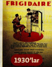
1930'larda Frigidaire buzdolabı reklamları.

20. yüzyılın ikinci çeyreği, Türki-ye'de kentlerin hızlı biçimde elektrikle-