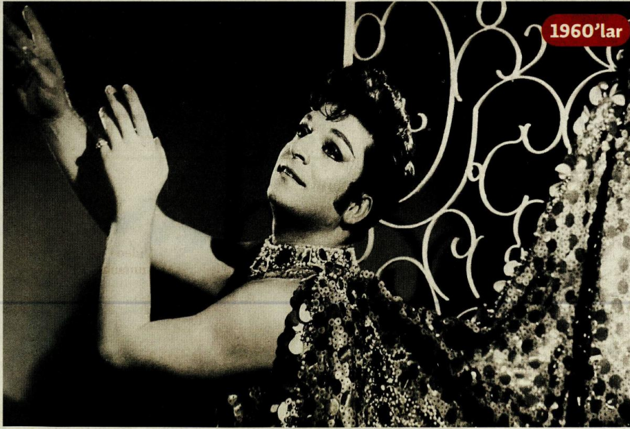
Sanat güneşi Zeki Müren 60'lı yılların ikinci yarısında Maksim Gazinosu'nda sahneye çıkıyordu.

Latin alfabesi Kasım 1928'de kabul edildi. Aralık 1928'den itibaren gazetelerin, Ocak 1929'dan itibaren de kitapların yeni alfabeyle basılması şart koşuluyordu. Bu dönemde dakti-