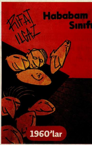
Turhan Selçuk'un Hababam Sınıfı çizimi.

Zeki Müren başlangıçta şöhret merdivenlerini ağır ağır çıktı. 19 yaşında radyo imtihanlarını kazanmıştı. 1 Ocak 1951 akşamı İstanbul Radyosu'ndan sesini milyonlara duyurdu. 1954'te Cahide Sonku'nun himayesinde ilk filmi Beklenen Şarkı vizyona girdi. 1954'te İzmir Fuarı'nda yayımlandı.