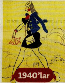
Ancabey'de Cemal Nadir'in çizimiyle bobstil kız, 1943.

lo yeni yazıyı şıpaş öğretene bir sihrili kutu muamelesi görüyor olmalıydı ki Memduh Şevket Esendal'ın Ayaşlı ile Kiracılar romanında iş görüşme-sinde bir hanım, yeni harfleri bilip bilmediğini soran müdürü şu yanıtı veriyordu: "Biliyorum. Gazeteleri okudum. Yazamıyorum ama makine ile olsa yazarım." Aynı yılın mayıs ayında Akşam gazetesine göre resmi makamlardaki yazı makinelerinin sayısı 6 bini aşmış, İstanbul'da kurulan Ameli Hayat Mektebi'ndeki daktilo kursundan 6 ay içinde 600 kadın mezun olmuştular.