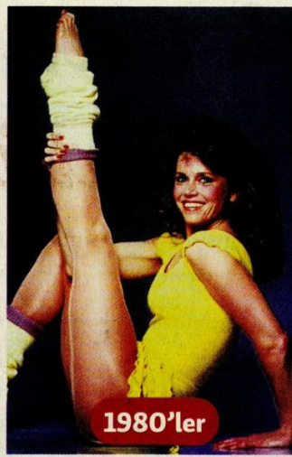
Jane Fonda'nın aerobik dersi