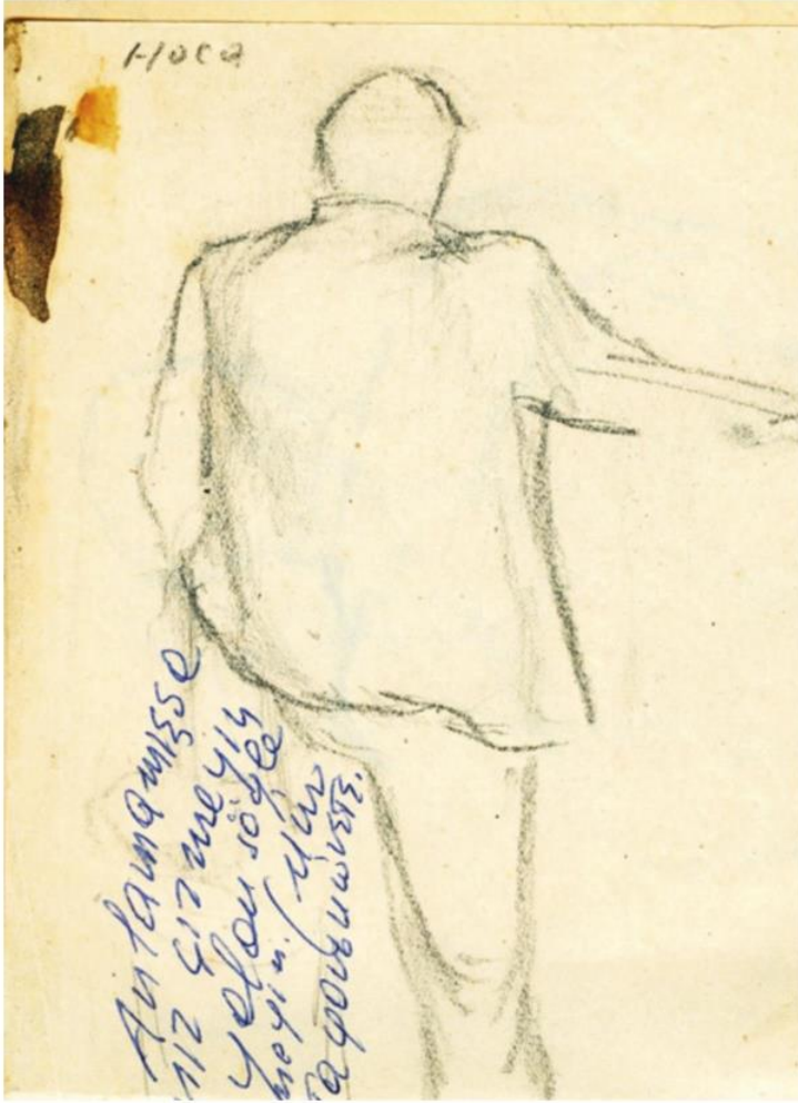
Eskiz defterlerinden Bedri Rahmi eskizi, 1942, anlamamışsınız çizmeyin, yalan söylemeyin.