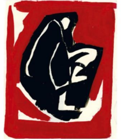
İvi Stangali hakkında Sula Bozic ve Seza Sinanlar Uslu'nun hazırladığı "Ressamı Hatırlamak" adlı kitap 2019 yılında YKY tarafından yayımlandı.

Bugün artık nedenler, keşkeler ve kurgusal çözümler üretmenin değil, yaşanmış olanları olanca çıplaklığıyla görüp, bir sanatçıyı kayboduğu yerde bulup, oradan çıkarıp yeniden ait olduğu yere yerleştirebilmenin gerekli olduğunu görüyoruz. Dolayısıyla İvi Stangali'yi gölgede kalmış biri olarak değil, İlhan Berk'in onda gördüğü ışıkla nitelendirip, İstanbul'da yaşamış, üretmiş, özel ve özgün bir ressam olarak saygıyla anmamız gerektiğini görüyoruz. Şimdi biliyoruz ki İvi, buradaydı ve resim tarihimizde bir yeri vardı... Hep de olacak ●