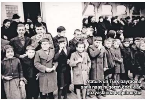
Atatürk'ün Türk bayrağına sarılı naaşını gören çocuklar, gözyaşlarına beğulmuştu.