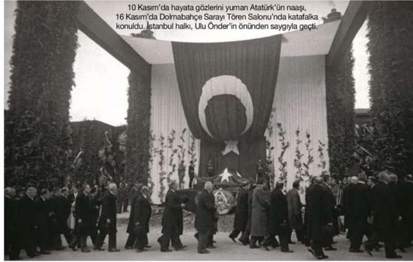
10 Kasım'da hayata gözlerini yuman Atatürk'ün naaşı, 16 Kasım'da Dolmabahçe Sarayı Tören Salonu'nda katafalka konuldu. İstanbul halkı, Ulu Önder'in önünden saygıyla geçti.

Türkiye Cumhuriyeti'nin kurucusu, gerçekleştirdiği devrimlerle çağdaş ve laik bir ülkenin mimarı olan Mustafa Kemal Atatürk, ölümünün 79'uncu yılında yurtta ve dünyada düzenlenecek birçok etkinlikle bugün yine hatırlanacak. Türkiye, saatler 9'u 5 geçtiğinde ayağa kalkacak