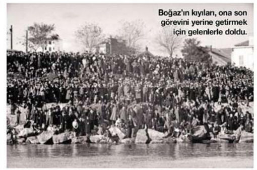
Boğaz'ın kıyılar, ona son görevini yerine getirmek için gelenlerle doldu.