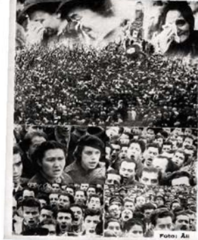
Atatürk'ün hayata veda ediliş, dönemin gazetelerinde günlerce manşetlerde yer aldı. Ülkenin yaşadığı hüznün, fotoğrafları yansıdı.