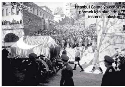
İstanbul Galata'ya cenazeyi görmek için akın edenler, insan seli oluşturdu.