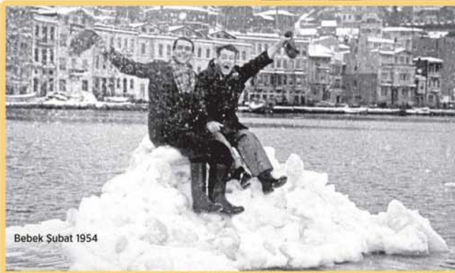
Bebek Şubat 1954

Felaket haber alınınca, yolları açmak için işçiler ve acil müdahale için bir doktorun da aralarında bulunduğu heyet, mahalleye gönderildi. Yardım heyeti ellerinde karpit lambaları, konyak, çay ve bir miktar yiyeceklerle yola çıktı. Gece karpit lambalarının ışığında yol açılarak binbir güçle mahalleye girildiğinde, 30 evin çoğunun yıkılmış olduğu görüldü. Sokaklarda geceki soğuktan donarak ölmüş kedi ve köpeklere rastlandı. Birçok yere kurtlar inerek mahalle aralarında dolaşmaya başladılar."