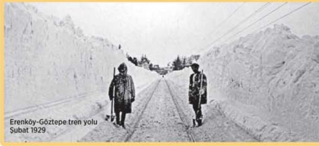
Erenköy-Göztepe tren yolu Şubat 1929