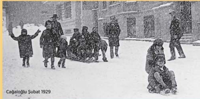
Çagağolu Şubat 1929