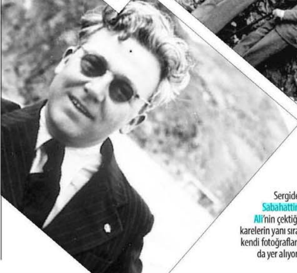
Sergide Sabahattin Ali'nin çektiği karelerin yanı sıra kendi fotoğrafları da yer alıyor.