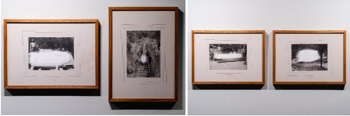
Akram Zaatari, "Olağandışı Bir Hadise", 2018, Fotoğraf:

Bir parantez; sergideki video içerikleri bütüncül bir biçimde kavrayabilmek için hatırı sayılır bir zaman ayırmak gerekiyor. Bu yüzden videolarda aktarılanları, zaman ayırma imkânı bulamayanlar için özellikle detaylandırmak istedim. Video içeriklerle etkileşimi artırmanın izleme konforu ve eser künyelerinde video sürelerinin ve video içeriğine dair kısa alıntılarının belirtilmesi gibi detaylarla ilişkisi olmakla birlikte Zaatari'nin eserlerinde zaman tasarımını esnek bir biçimde kurguladığını, izleyicinin eserlerin kendine hitap ettiği ve anlam bulduğu kadarını alıp gitmesine razı olduğunu sanıyorum.