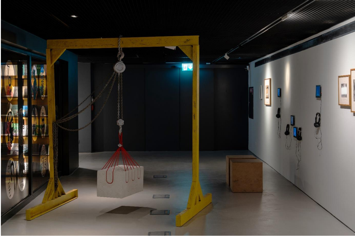
Akram Zaatarı, “Yok Olmayı Reddeden Her Şey”, Fotoğraf:

Sergi kapsamında gerçekleşen konuşmasında Edhem Eldem, Zaatarı'nın işlerinde arşiv malzemesi ile arkeolojik ve tarihsel bilgiyi işleyerek bir bağlama yerleştirdiğini ve tartışmaya açtığını belirtir. Koleksiyona eleştirel bir bakışla katmanlı ve katmerli bir biçimde bir tarihinin kolayca açığa çıkaramayacağı sorunları ortaya koyduğunu aktarır. Ona göre, tarihinin yapamadığını sanatçı yapmıştır. Zaatarı, cansız kılınan objelere insani bir boyut getirir. Arkeolojinin insanları objelerle temsil ederken hoyrat davrandığını ve sanatçının bunu görünür kıldığını vurgular. 2 Bu tarihsel arkeolojinin insanileştiği perspektifi en çok hissedebileceğimiz işlerden biri, Akram Zaatarı'nın Khodr Zaatarı'nın anlatsıdır. Sayda kazısı sürecini ve arka planını, kuşaklararası aktarım yoluyla Khodr Zaatarı'den dinleriz. Sözlü tarih, bugünden bağ kurabileceğimiz bir hikâyeye erişmemizi sağlar. Üstelik yazılı kayıtlarda bulamayacağımız derinlikte, duyumsanabilir ve öznel bilgiyi içeren bir nitelik taşır.