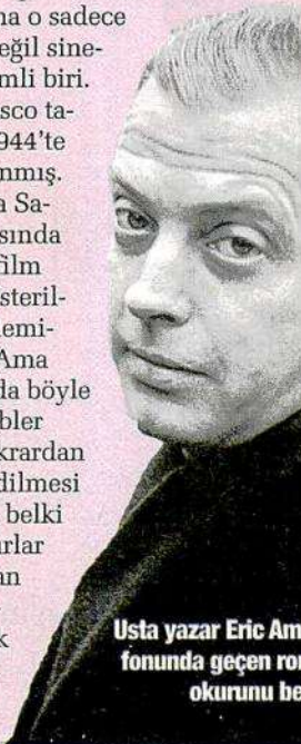
Usta yazar Eric Ambler fonunda geçen romanın okurunu be...