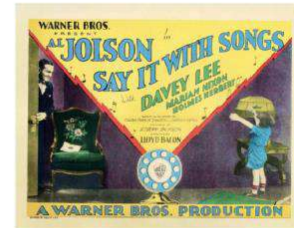
Onu Şarkı ile Söyle (Say It With Songs)

tip bu filmin yurt dışında gösterilmesini sağlıyor. Halkın eğitim ve kültür seviyesini artırmak ve rejimin temel ilkelerini özümseyen nesiller yetiştirmek için açılan Halkevlerinde sürekli bu tarz filmlerin gösterilmesine onayak oluyor.