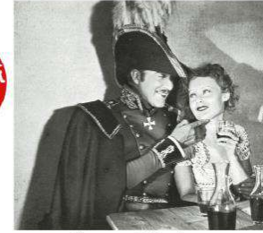
Kongre Eğleniyor (Der Kongress tanz)