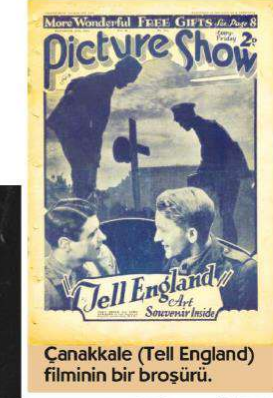
Çanakkale (Tell England) filminin bir broşürü.

Atatürk sinemanın kısa bir sürede yeryüzünün çehresini değiştireceğini, insanlar arasındaki görüş, düşünüş farklılıklarını silceğini ve insanlık idealinin tahakkukuna en büyük yardımcı yapacağını düşünüyör. Sinemanın aynı zamanda önemli bir propaganda aracı olduğunun da farkında. Bu bağlamda ulus-devletin inşa-