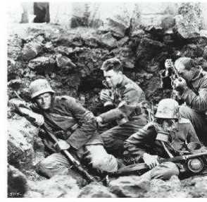
Batı Cephesi'nde Yeni Bir Şey Yok filminden bir sahne.