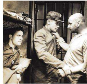
Demir Kapı (Big House-Revolt) dans la prison)