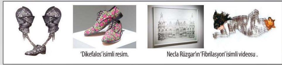
'Dikefalos' isimli resim.