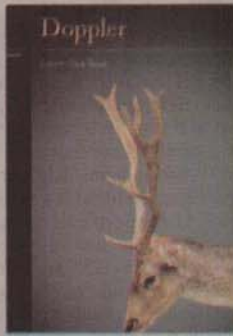
DOPPLER Yazar: Erland Loe Çevirmen: Dilek Başak Carelius Yayınevi: Yapı Kredi, 2016

Onu ilk andan itibaren sevdim. Doppler'i yazma fikrinin tam olarak nereden kaynaklandığını hatırlamıyorum ancak Oslo'da ihtiyaçlarını doğadan karşılayan ve doğanın içinde yaşayan bir adamı yazmak istiyordum. Çıkış noktası buydu, ama sonra ailesini terk etmiş olsa, yalnız yaşasa daha ilginç olabilir diye düşündüm.