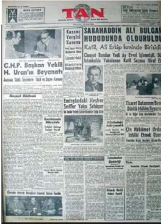
Sabahattin Ali'nin ölümü ancak cinayetle yaklaşık 9 ay sonra gazetelerde ilan edildi. 12 Ocak 1949 tarihli Tan gazetesinde Ali'nin ölüm haberi yer alıyor.

enstitülerinin kapatılmasına yönelik olumsuz propagandaya başlanıyor. Sabahattin Ali de daha önceden değer verilen, ciddiye alınan bir muhalifken şimdi ötekileştirilen ve dışarı itilen bir muhalif oluyor. Artık Ankara'da yaşamının imkânı olmadığından İstanbul'a geliyor. Aziz Nesin de o tarihlerde dergi çıkarmaya çalışıyor. Sabahattin Ali'nin ekonomik desteğiyle bu dergiyi birlikte çıkarma kararı alıyorlar. İkisinin de CHP'nin yönetimdeki yanlışlarını, DP'nin iktidara gelme sürecini, Türkiye ile ABD ilişkilerini eleştiren bir çizgisi var. Zor şartlar altında yayımladıkları Markopaşa çok ciddi bir karşılık ve yankı buluyor halkta.