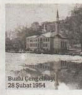
Buzlu Cengizliboy 28 Şubat 1954