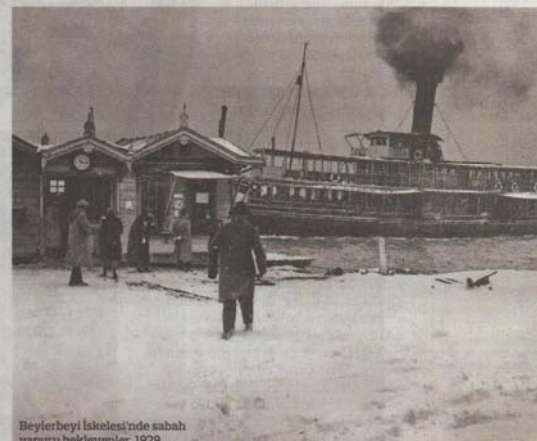
Beylerbeyi İskelesi'nde sabah vapuru bekleyenler. 1929