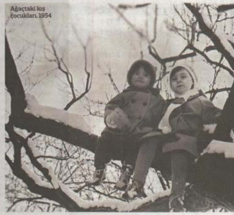
Ağaçtaki kış çocukları 1954