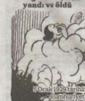
9 Ocak 1929 tarihli Gümbürhüye