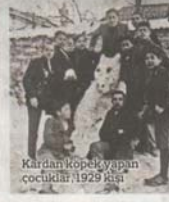
Kardan köpek yapan çocukları 1929 kış