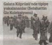
Galata Köprüsü'nde tipteye yakınlananlar