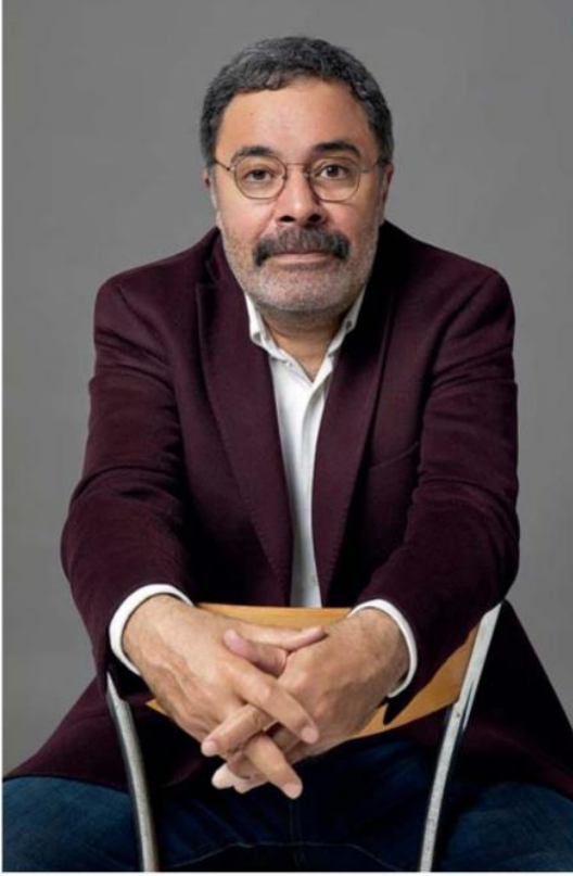
Ümit bu romanı yazarken 'ilk ülkem' diye adlandırdığı çocukluğuna döndüğünü söylüyor.

yerden yürümeye başladılar, bir süre sonra orası yola dönüştür. İnsan yolu dönüştürürken yol da insanı dönüştürür. Bu çok önemli. Bilimsel olarak kullandığımız yöntem, sonucu belirler diyebiliriz. Ama unutmamak gerekiyor insanızı. Bir tarafımız hep eksik, hep noksan. Nietzsche'nin lafını çok severim: "İnsan tamamlanmamış bir varlıktır." Eksikiz, olmamışız. O yüzden aşkın yıkıcı tarafı öne çıkıyor. Şiddetten uzak bir yanımız olsaydı belki aşkı çok daha güzel yaşayabilirdik, bilmiyorum. Belki aşk o zaman bu kadar cazip olmayabilirdi, onu da bilmiyorum. Emin değilim. Birçok yazar bu işin içinden çıkamamış. Dostoyevski bütün bunları çözemediği için dine sarılmış. "İnsan acizdir bir Tanrıya inanmak gerekir," diye düşünmüş. Ben böyle düşünmüyorum. Bence insan düzelebilir. Benim hâlâ umudum var. Ama çok acımasız eleştirmek gerekiyor. Bu kitap da o yüzden çok acımasız.