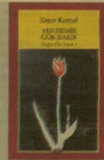
YER DEMİR GÖK BAKIR