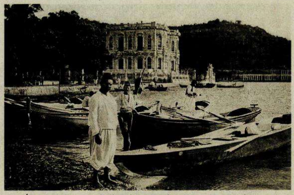
İstanbul. Asya'nın Tatlı Suları. Küçüksu Kasrı, 19. yüzyıl sonu.