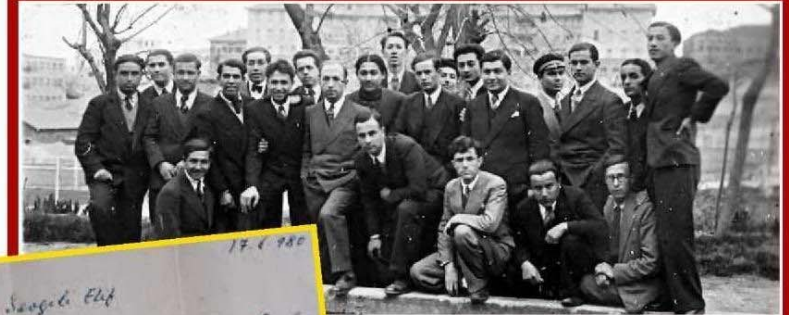
(Üstte sağdan üçüncü) Oktay Rifat , (arka ortada) Orhan Veli , Ankara Erkek Lisesi.