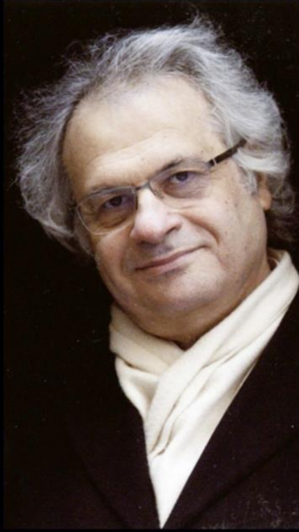
Amin Maalouf'un söyleşisinin tarih ağırlıklı bölümü, Atlas Tarih'in yeni sayısında okunabilir.

Yazarın Yunan doğa düşünürü Sicilya Agrigento'lu Empedokles'i seçmesi de tesadüf değil. Empedokles, İÖ 400'lerde hava, su, ateş ve toprak olmak üzere dört element teorisini ortaya atan, kanlı hayvan ritüellerini kınayarak vejetaryenliği savunan (bunda insan ruhunun bedenlerdeki göçüne