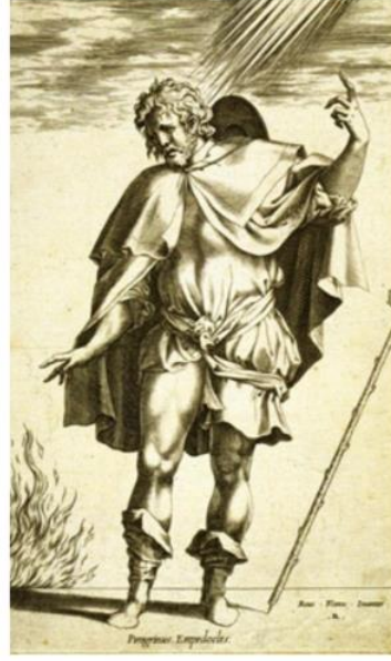
Yunan doğa düşünürü Empedokles, İÖ 490'da Sicilya Acragas'ta doğdu, ölümü ise efsanelere kaynaklık etti.

İnsanlık tarihinin çok zorlu bir döneminden geçiyoruz, son bir yıl da bunun bir kanıtı. Sanıyoruz ki bu süreç bir parantez, parantezi kapayınca eski hayatlarımıza döneceğiz. Bu doğru değil.