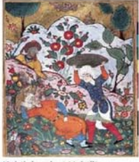
Kabil, kardeşi Habıl'ı öldürüyor (Falname).