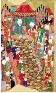
Lala Mustafa Paşa, Doğu Seferi'nde (Nusretname).

"SAFAVİ-Osmanlı Savaşı'nın ganimeti olarak Şah İsmail'in tahtı Topkapı Sarayı'nda sergileniyor. O da bir Türk padişahı. Onun da gelenekleri var. Taht ile birlik geliyor cepheye, kaybedenin değerli eşyaları alınıyor ya da geri çekilirken bırakılıyor. Kitaplar, minyatürler de öyle. İran, o dönemde en az Osmanlı kadar ileri bir medeniyet. Çok sayıda ünlü İranlı sanatçı daha sonra Osmanlı baskentine gelmiş."