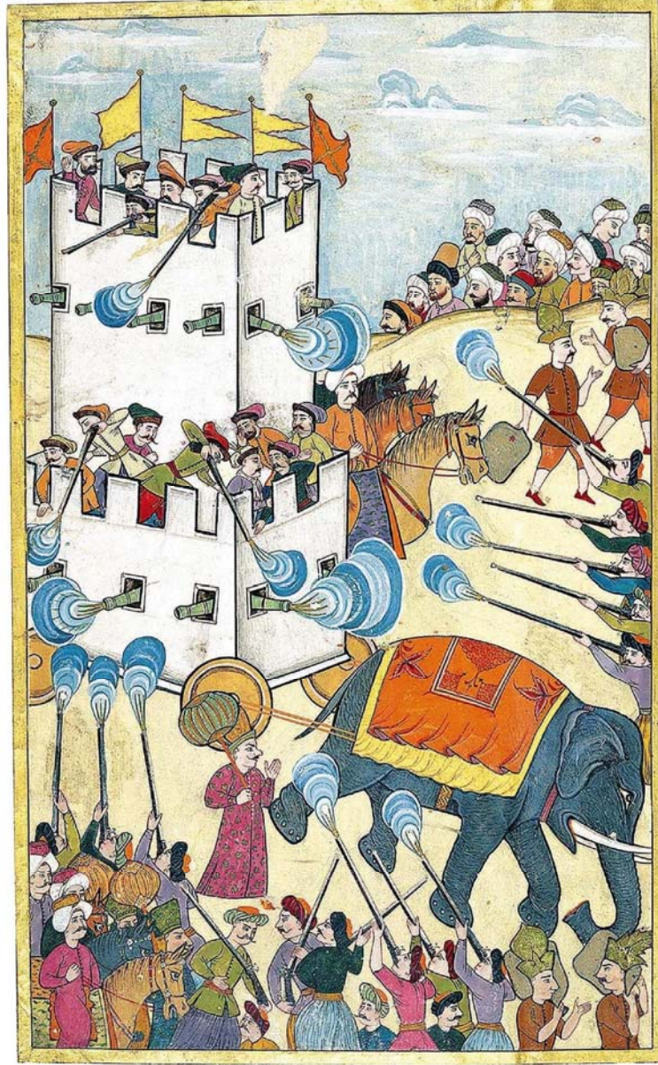
1720 Senliğinde, yalancı kale savaşı (Sürname-i Vehbi).