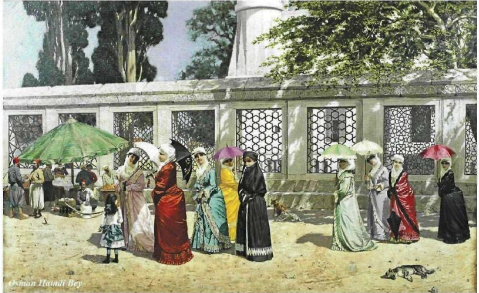
Osman Hamdi Bey

"PastPresentFuture" hem kültürler arasında hem de resim, fotoğraf, enstalasyon ve heykellerin yan yana bulunduğu antik ve çağdaş eserlerle sanatlar arasında diyalog kuruyor. Böyle bir tematik fikir alışverişi, izleyenlere duyulara ve zihne