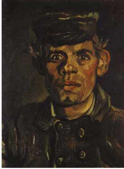
502 Nuenen, Cuma 22 Mayıs ya da dolayları, 1885