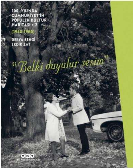
“Belki Duyulur Sesim” kitabının kapağında Zeki Müren ve Nedret Güvenç (üstte). Sanat Güneşi Zeki Müren, 60’lı yılların ikinci yarısı (sağda).

Toprağın, yağmurun, güneşin bir oyunu. İklimin emri. Kuzeyde çay yetişti ama güneyde inadına kahve yetişmedi. Rize’de çay ziraatı, eşlerini, babalarını gurbete ve askere gönderen kadınların bir kahramanlık öyküsüdür. Ama kahve fidanları Halikarnas Balıkcısı’nın mahir ellerinden bile kaydı gitti. Kahve yokluğu öncelikle dünya savaşlarının bir gerçekliği ve metaforuydu, sonra 50’li yıllarda uluslararası iktisadi krizin ve siyasi beceriksizliğin bir parçası oldu. Neyse ki çay imdada