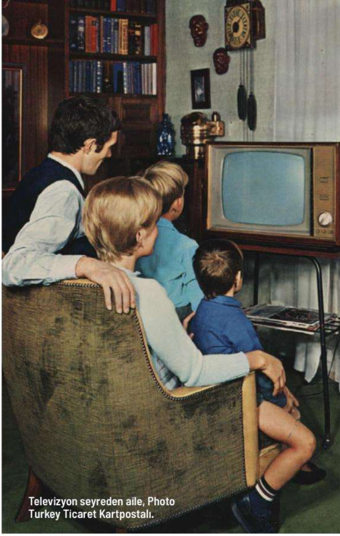
Televizyon seyreden aile, Photo Turkey Ticaret Kartpostalı.

“Müzikte devrim, 1950’li yılların başında Zeki Müren ile başladı. 1955’te Galatasaray’a transfer olan Metin Oktay, Türk futboluna damgasını vurdu.”