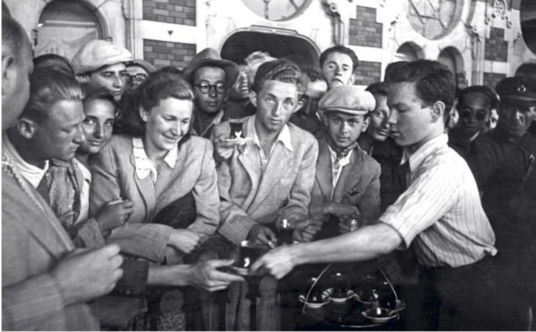
Sirkeci Garı'nda çay servisi (Yapı Kredi Selahattin Giz Arşivi).