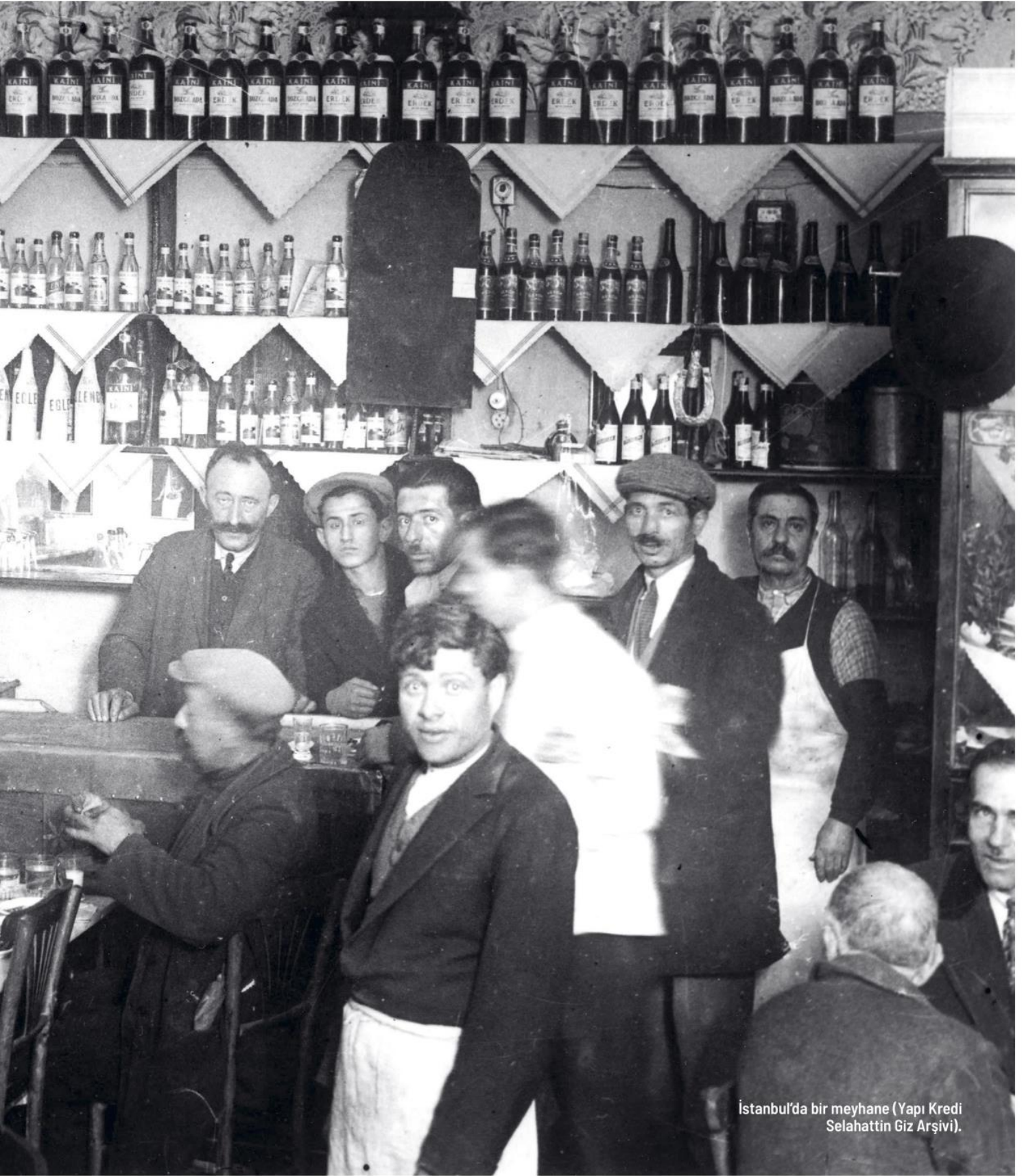
İstanbul'da bir meyhane.