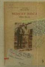
BEHÇET HOCA Hilmi Yavuz Everest Yayınları, 2019 160 sayfa, 29 TL