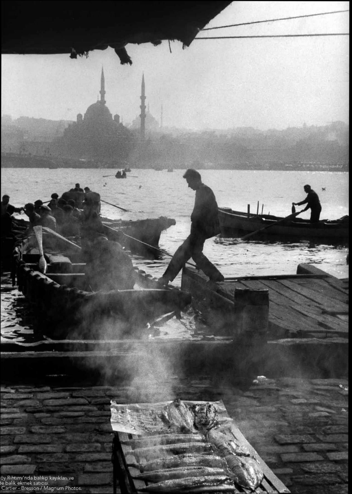
Karaköy Rıhtımı'nda balıkçı kayıkları ve sahilde balık ekmek satıcısı.