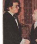
CUMHURBAŞKANI'NIN HUZURUNA BÖYLE ÇIKILMAZ...