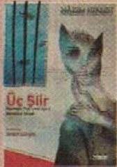
Üç Şiir Nâzım Hikmet Res: Sedat Girgin YKY, 54 s.

Suda suretimiz çıkıyor, çınarın, benim, kedinin, güneşin, bir de ömrümüzün. Suyun şavkı vuruyor bize çınara, bana, kediyeye, güneşe, bir de ömrümüze."