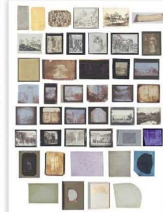
İlk fotoğraf baskı sergisinden kareler.

Sanatçının burada ziyaretçilerde yaratmış olduğu etki, aynı zamanda zaman içerisinde de süregelen ve bir devamlılığı olan Talbot'un ilk fotoğraf sergisine gelen ziyaretçilerin tepkilerini de yansıtıyor ya da düşündürüyor. 1830'lü yıllarda İngiltere'de kurulmuş olan Britanya Bilimsel İlerleme Derneği tarafından gerçekleştirilen etkinliklerde bilimsel buluşlar tartışmaya açılıyor, ortak mekânlarda sergileniyordu. 1839