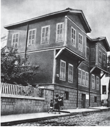
Selanik'te doğduğu ev