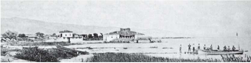
Zübeyde Hanım'ın çocukluğunun geçtiği Langaza...

Varlıklı bir ailenin biricik kızı olan Zübeyde dadılarla büyüye de, zamanın âdetleri uyarınca her genç kız gibi ev kadını olarak yetiştirildi. Önce ev işinde ustalaştı, arkasından nakış işlemeyi öğrendi. Yeni biçilmiş çayırların kokusuyla uyanır, üzerine düşen işi yapar yapmaz örneğini seçer, gergefini kurar, kasnağını gererdi. İbrişimleri, altın ve gül klapdanlarıyla nakışına koyulduğunda hayal dünyasına doğru bir yolculuğa çıkardı.