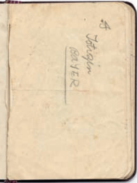
1 Istizin BAYER

Istizin, Alman ilaç şirketi Bayer'in bir ilacı. Bayer İlaç'ın vademecum'unda "abführmittel" diye geçiyor, yani müshil. Bağırsakları yumuşatıcı, çalıştırıcı bir etkisi var. Istizin, ilaç olarak da girmiş olabilir deftere, logosu şairin dikkatini çektiği için de... İlacın adını yazarken daha ilk harfte beğenmeyip hemen altından devam etmiş.