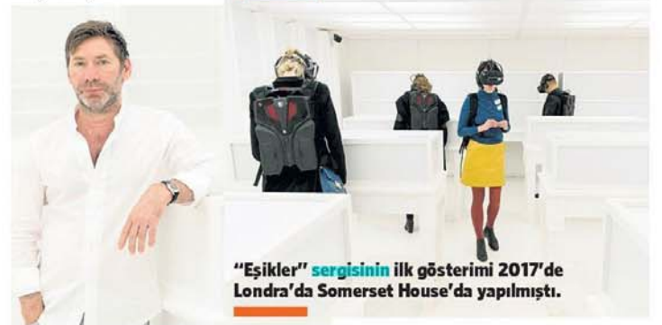
"Eşikler" sergisinin ilk gösterimi 2017'de Londra'da Somerset House'da yapılmıştı.