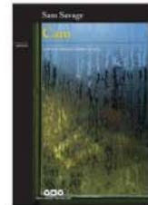
CAM Sam Savage Çeviren: Devrim Deniz Cavus YKY, 2017 160 sayfa, 15 TL

'Cam', kişiliğin tuhaflıkları ve derinlikleri üzerine ilgi çekici, felsefi derinliği olan zarif bir roman.