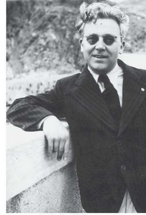
Sabahattin Ali, Ankara'ta.