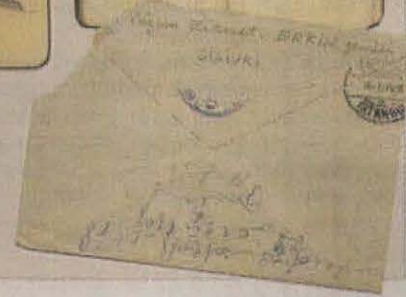
Resimaltı: Nâzım Hikmet'in Kemal Tahir ve Piraye ile fotoğrafı. Hapishanede tuttuğu defterlerden ve gönderdiği mektuplardan bazıları ile birlikte...